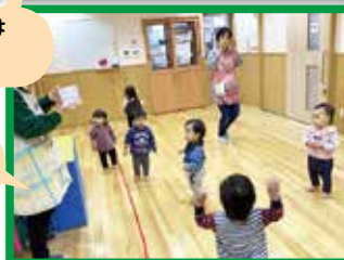
今日は何して あそぼうかな～♪