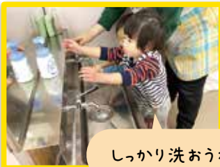
しっかり洗おうね♪